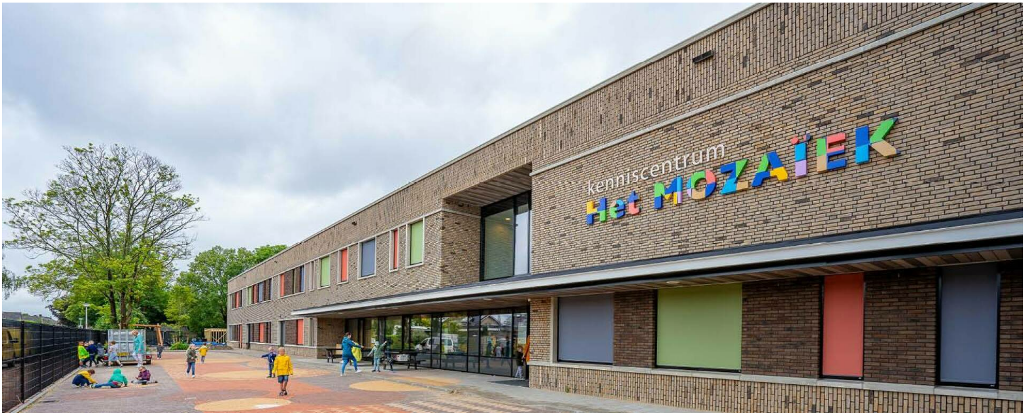
Kenniscentrum Het Mozaïek Oud-Beijerland

Onder de noemer Kenniscentrum het Mozaïek , realiseren wij een passend leer- en zorgaanbod voor alle leerlingen en cliënten in de regio Hoeksche Waard. Alle groepsruimtes zijn voorzien van een prikkelgedoseerde ruimte, extra werkplekken en digitale schoolborden. Verder zijn er aparte praktijkvaklokalen voor de diverse branches, o.a. een professionele keuken en een technieklokaal, maar ook een buitenruimte met een grote kas naast de schooltuinen voor de lessen groen.